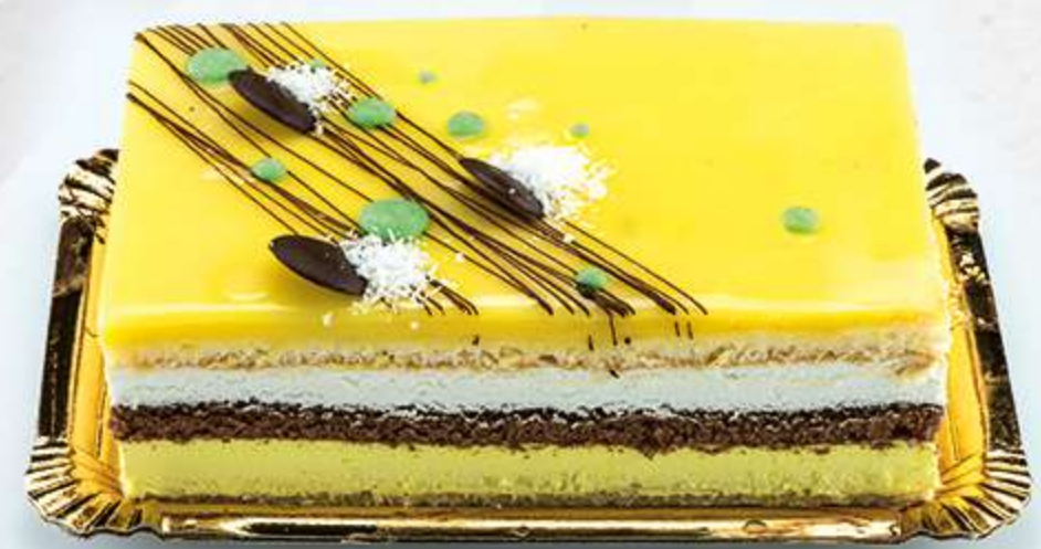
Tarta de limón Bizcocho de cacao con nata, espuma de limón y cubierta de limón