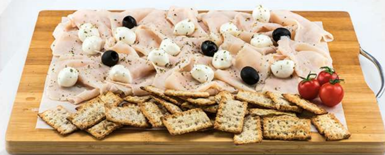
Tabla de pechuga de pavo y mozzarella