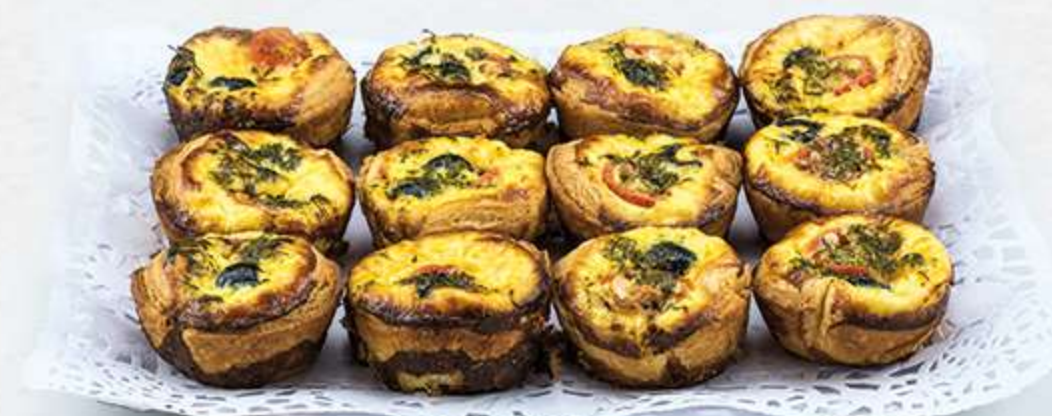
Surtido de miniquiches horneados