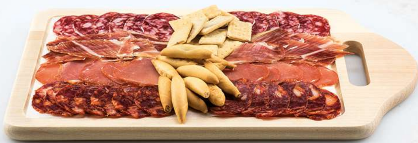
Surtido de ibéricos