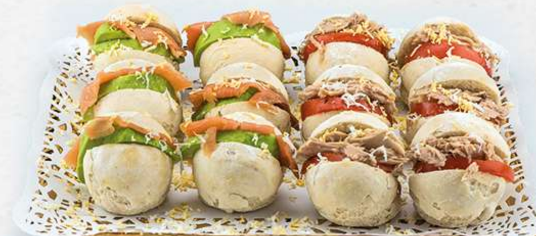
Surtido de payesitos variados

DISPONEMOS DE UNA AMPLIA VARIEDAD DE RELLENOS, ELABORADOS DIARIAMENTE Y UTILIZANDO PARA TODOS ELLOS INGREDIENTES DE PRIMERA CALIDAD