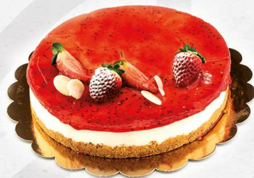
Cheesecake Base de galleta con queso y frambuesa / limón