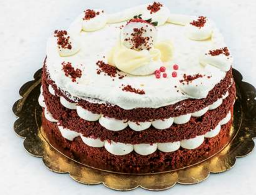
Tarta velvet Bizcocho velvet con nata y crema de queso

EL HECHO DE CREAR TODAS LAS TARTAS EN NUESTRO OBRADOR PROPIO HACEN QUE PUEDES DISFRUTAR DE SU ESENCIA TRADICIONAL