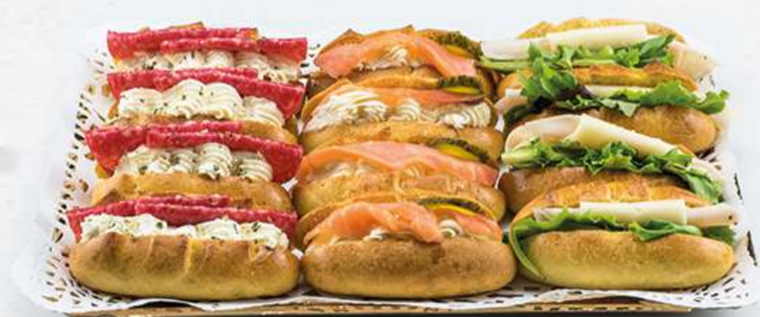
Surtido de medias noches rellenas