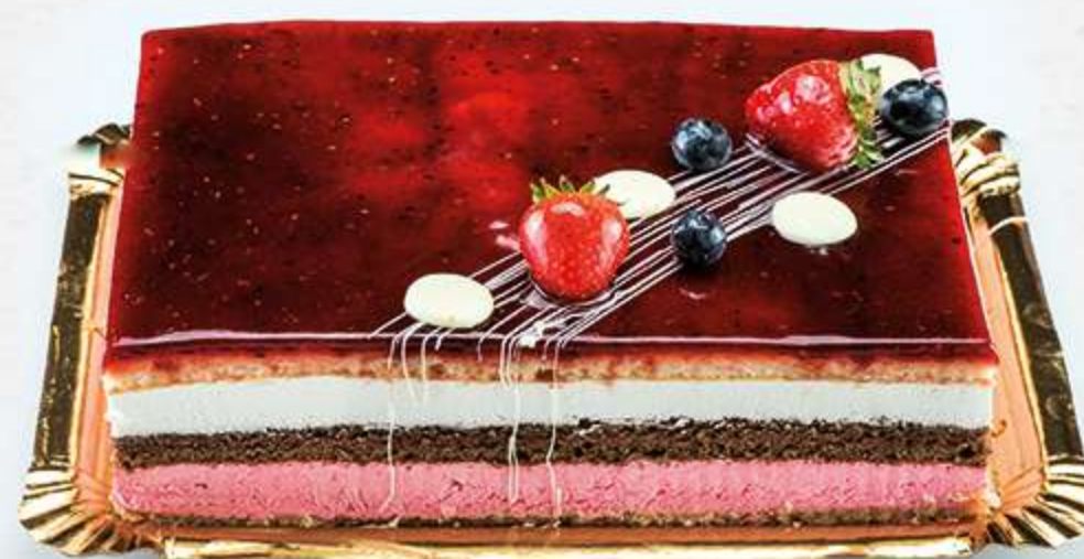
Tarta frambuesa Bizcocho de cacao con nata, espuma de frambuesa y cubierta de frambuesa