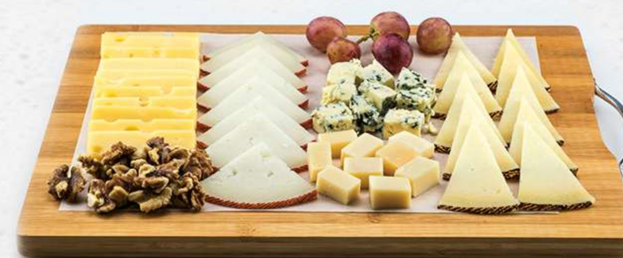
Tabla de quesos del mundo

GRACIAS A UNA EXAHUSTIVA BÚSQUEDA DE LOS MEJORES FIAMBRES Y QUESOS, PODEMOS OFRECERLES UNAS AUTÉNTICAS DELICIAS GOURMET