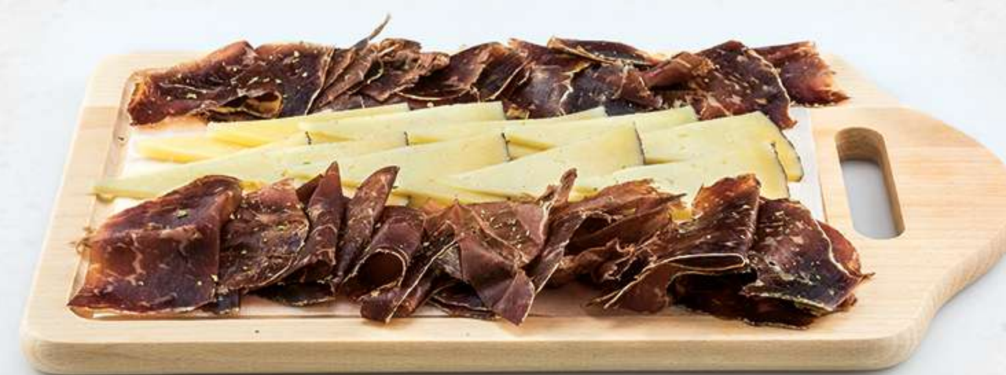
Tabla de cecina y queso curado