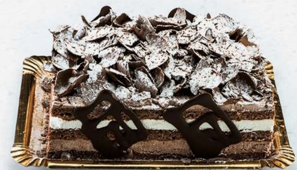
Tarta Selva Negra Bizcocho de cacao con nata, trufa y láminas de chocolate negro