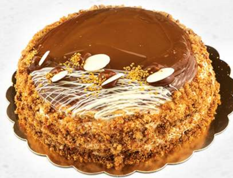
Tarta de caramelo Bizcocho de toffee con nata y dulce de leche