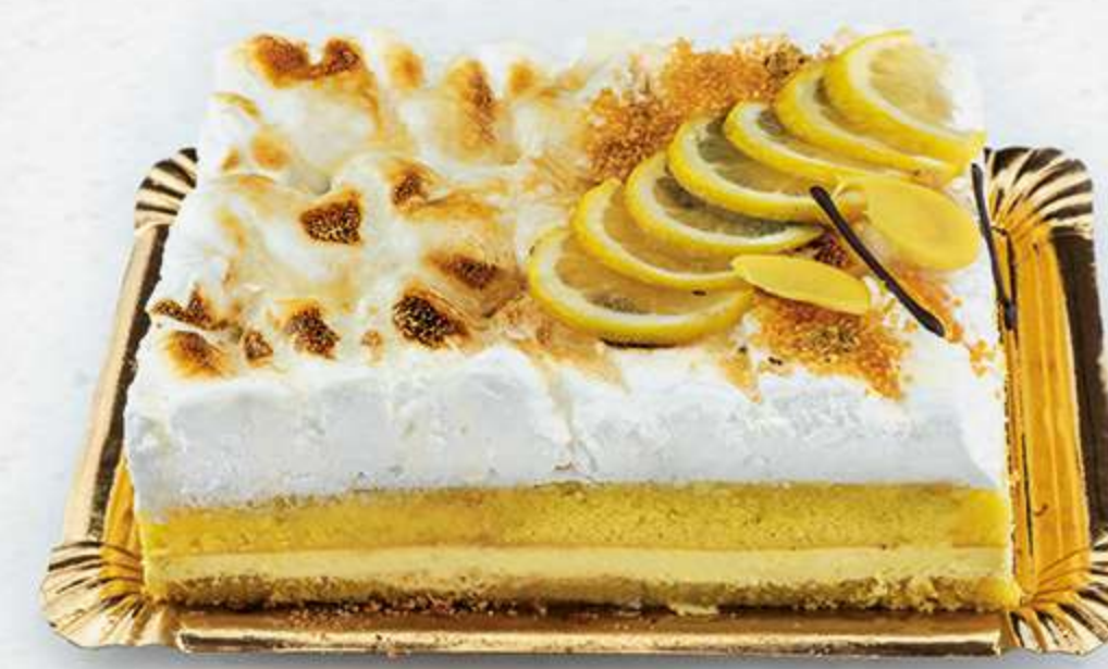
Lemon Pie Soufle con bizcocho, y crema de limón