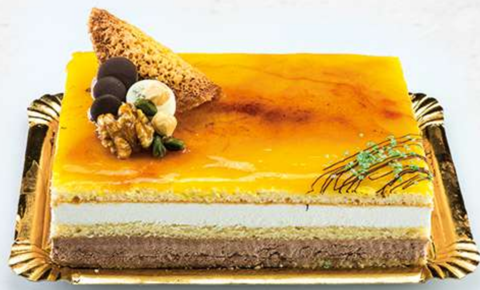
Tarta San Marcos Bizcocho natural con nata, trufa y yema tostada