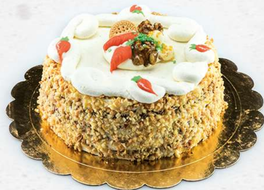
Carrot Cake Bizcocho de zanahoria con nata y crema de queso