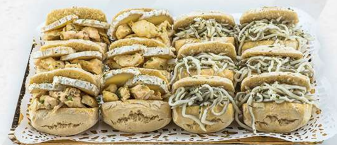
Surtido de chapatitas rellenas