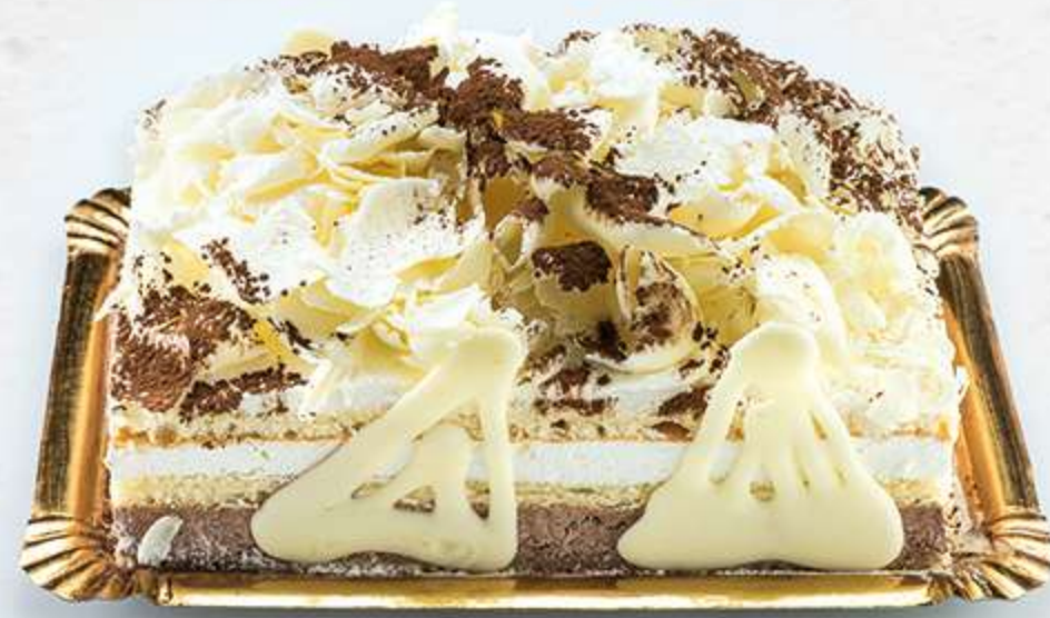
Tarta Selva Blanca Bizcocho natural con nata, trufa y láminas de chocolate blanco