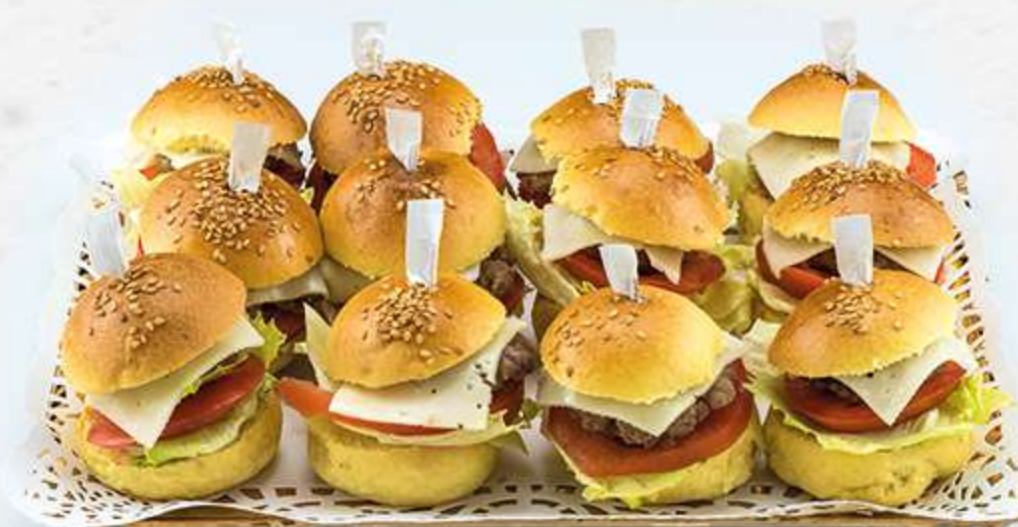
Mini-hamburguesas de ternera