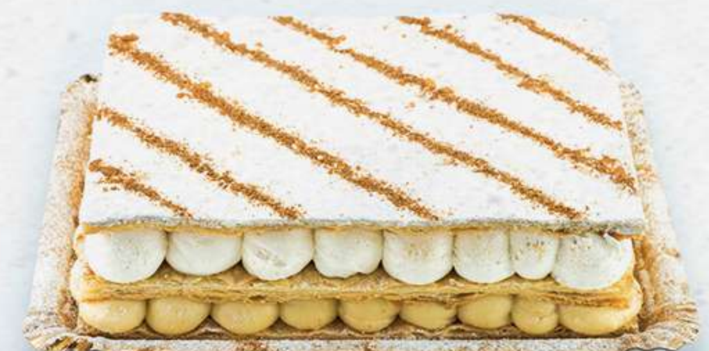
Tarta milhojas Láminas de hojaldre con nata y crema pastelera

MAS DE DOS DÉCADAS DE EXPERIENCIA CREANDO TANTO TARTAS CLASICAS COMO NUEVAS RECETAS QUE TE HARAN DISFRUTAR DEL DULCE