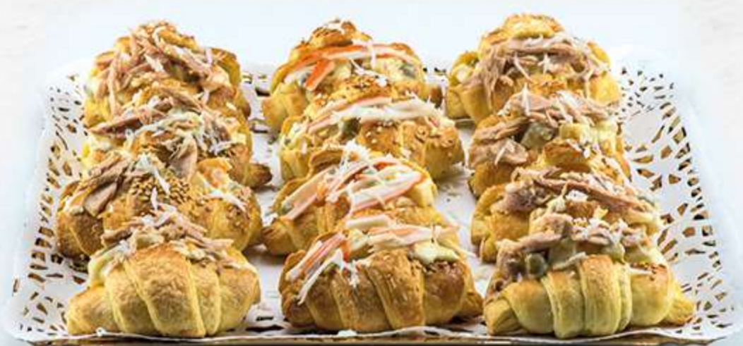
Surtido de croissants rellenos