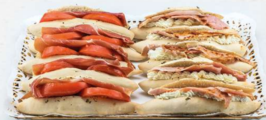
Surtido de flautines rellenos