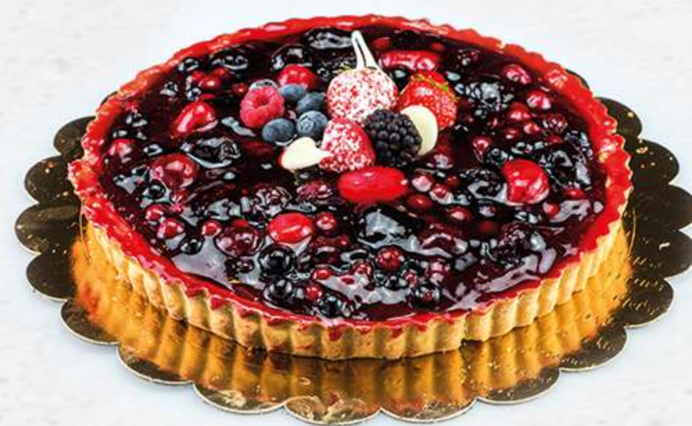
Tarta frutos rojos Base de sable con crema natural y frutos rojos