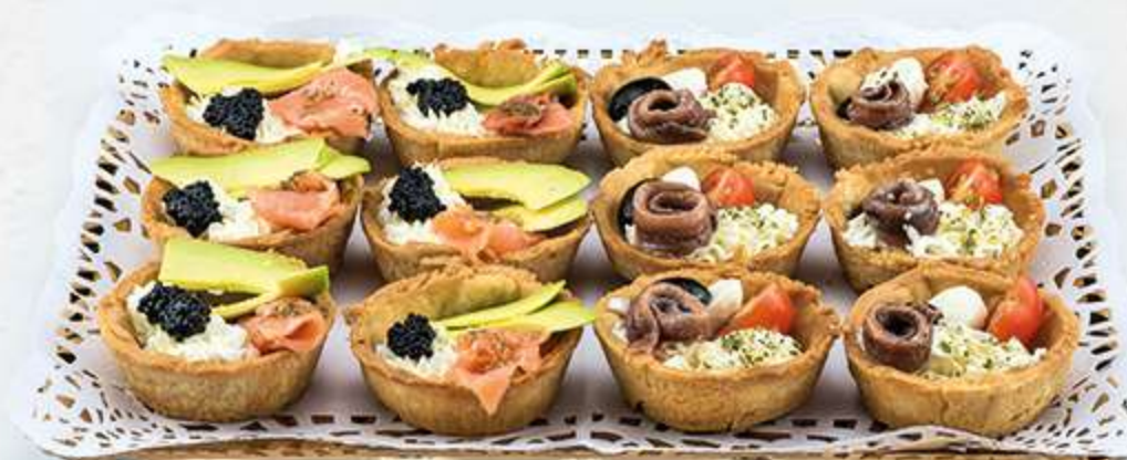
Surtido de tartaletas variadas