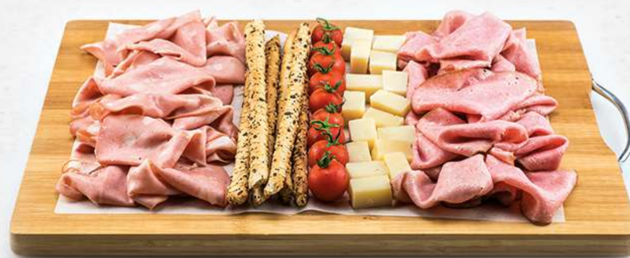
Surtido de mortadelas y parmesano